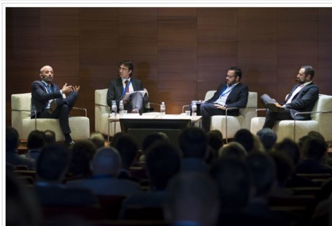
Debate con Royo Group, Plásticos Vipers y Ebir Iluminación.

Agradecemos desde esta publicación la magnífica acogida que ha tenido el Congreso que aportó conclusiones y claves de trabajo en este encuentro que reunió a más de 250 empresarios y profesionales de los sectores del hábitat de todo el territorio nacional celebrado el pasado 19 de octubre en el Centro de Eventos de Feria Valencia.